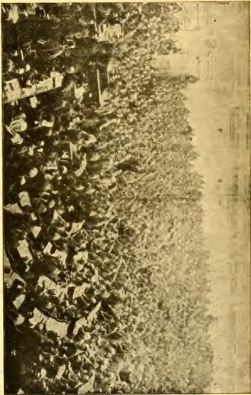
א זיכונג פון פעטערבורגער ארביטער-און סאלידאטן-ראט.